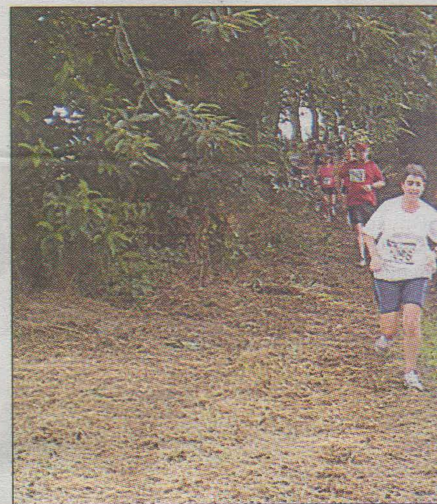
Une course 100 % au cœur de la nature.

Pour sa deuxième édition, le trail des corsaires courra sur les traces des descendants de notre illustre malouin Robert Surcouf. C'est sur un parcours de 14 km, sans difficultés majeures, exclusivement dans la forêt domaniale du Mesnil que l'association les Gros Mollets du Tronchet et de Saint-Pierre de Plesguen invite les participants à venir découvrir les sentiers. Ce parcours très agréable pour les gens qui aiment la nature verra la visite des principaux sites de la forêt, avec le bassin à rouir le lin, les vestiges des fours à bois, et l'allée couverte de l'ancienne sépulture néolithique. C'est donc plus de 200 participants qui sont attendus cette année pour le départ fixé à 15 heures au centre bourg de Tressé avec l'arrivée au même lieu. Un tee-shirt