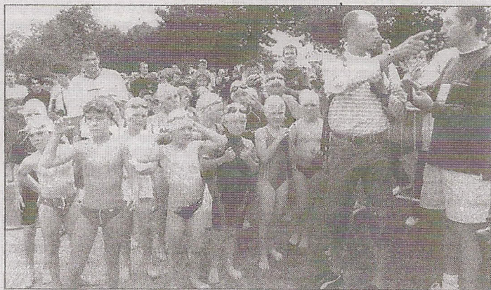
Le départ du triathlon est donné par l'épreuve de natation.

Le premier temps de la journée (11 h) du dimanche 26 mai sera réservé aux enfants. Le triathlon avenir Mc Donald's kids est une épreuve destinée à faire découvrir cette discipline dès l'âge de 8 ans. Les distances sont tout à fait adaptées : pour les poussins (1993/94) 25 m de natation, 1000 m en VTT et 300 m de course à pied, pour les pupilles (1991/92) 40 m de natation, 1700 m en VTT et 500 m de course, pour les benjamins (1989/90) 100 m de natation, 3 100 m de VTT et 800 m de course et pour les minimes (1987/88) 150 m de natation, 3900 m de VTT et 1000 m de course. « Nous souhaitons par ces distances tout à fait adaptées aux enfants, même pour les non initiés,